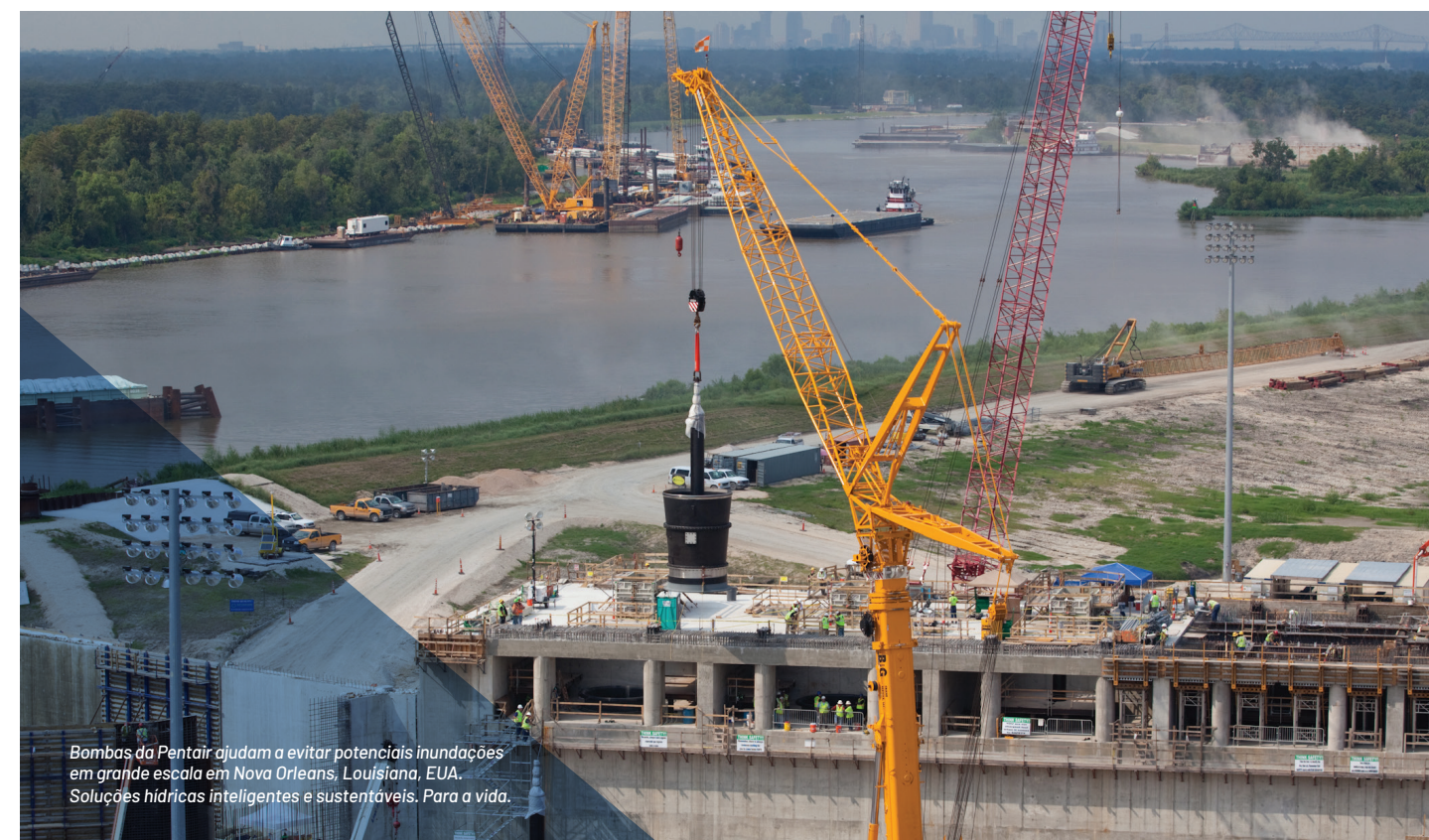
Bombas da Pentair ajudam a evitar potenciais inundações em grande escala em Nova Orleans, Louisiana, EUA. Soluções hídricas inteligentes e sustentáveis. Para a vida.

R: Apesar de a visita à planta talvez ser aceitável, a viagem à Disney World não é permitida e é uma forma de suborno. Sob nenhuma circunstância podemos pagar para familiares de um cliente viajarem com ele para a Disney World ou qualquer outro destino não relacionado aos negócios da Pentair.