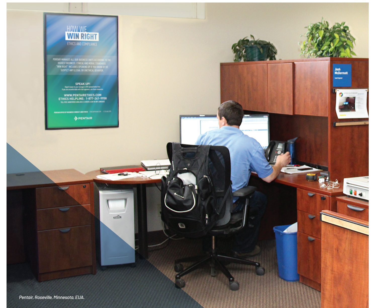
Pentair, Roseville, Minnesota, EUA.

R: A Pentair leva alegações de retaliações muito a sério. Isso significa educar funcionários e gerência sobre o que pode aparentar retaliação e garantir que eles compreendam as consequências. Se uma alegação de retaliação tiver fundamento, a empresa disciplinará os indivíduos envolvidos, incluindo até sua demissão.