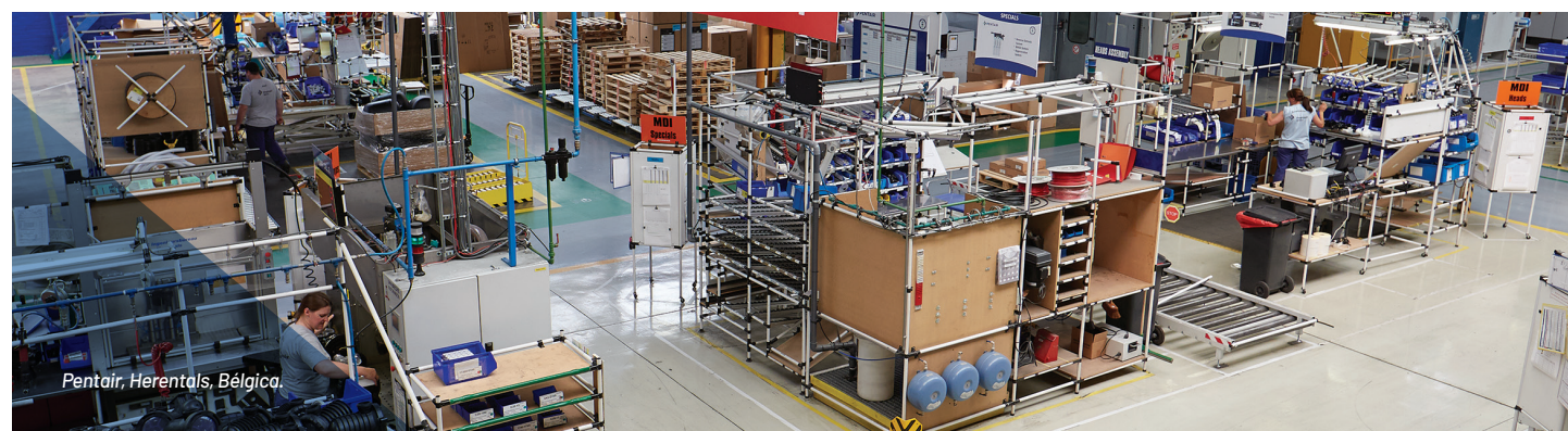
Pentair, Herentals, Bélgica.

A Pentair investigará todos os incidentes, lesões e quase-acidentes com os objetivos de implementar ações corretivas permanentes e da raiz do problema nunca se repetir.