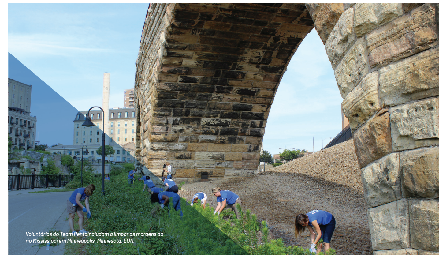
Voluntários do Team Pentair ajudam a limpar as margens do rio Mississippi em Minneapolis, Minnesota, EUA.

Qualquer renúncia ao Código para executivos ou diretores pode ser feita apenas pelo Conselho de Diretores da Pentair ou pelo Comitê de Governança do Conselho.